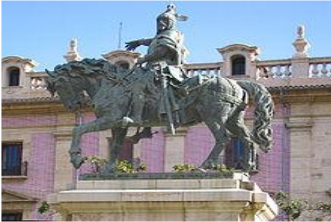
Estatua de Jaume el Conqueridor (a la plaça d'Alfons el Magnànim)

També coneguda com El Parterre és una plaça de la ciutat de València situada a la fita entre els barris de Sant Francesc i la Xerea, al districte de Ciutat Vella. Construït pel 1850 sobre uns solars de l'antiga Plaça de la Duana.