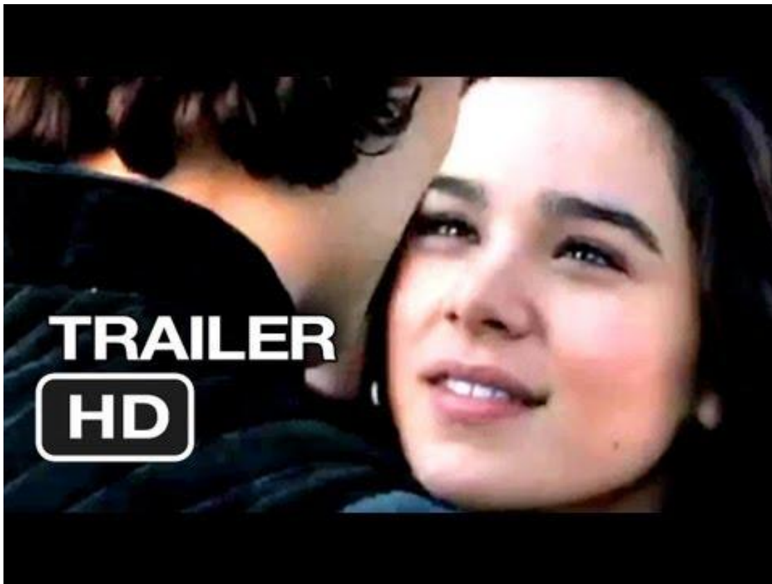
Recreación cinematográfica “Romeo y Julieta” de Shakespeare